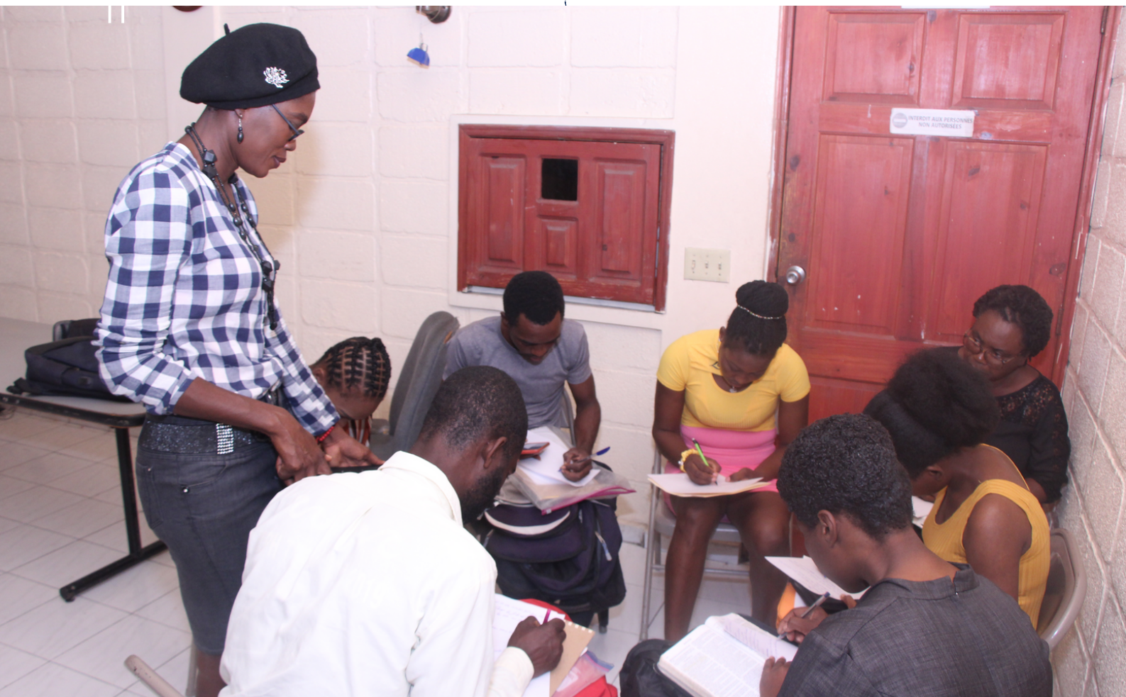
Des moniteurs associés lors de la rencontre du mois de février, à l'auditorium Joel Maurice de l'église Baptiste Bérée

C'est une conférence d'inspiration, de ressourcement et de mobilisation sur le ministère auprès des enfants. Pour la période nous avons planifié de réaliser une édition dans le plateau central de concert avec la World Vision, cependant en dépit de la dégradation du climat de sécurité, notre partenaire a jugé nécessaire de reporter ladite conférence pour la période estivale, soit le 19 Août 2023.