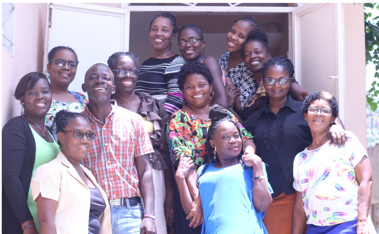
Des participants du cours " Méthodes progressives d'évangélisation des enfants" en avril 2023

Plus de quatre-vingt deux (82) étudiants formés dans deux (2) cours de super séminaire, pour le compte de l'organisation Food for the Hungry, l'un à Belladère, et l'autre à Kenscoff dans le cadre d'un accord de partenariat qui s'étend sur trois années. A noter que nous sommes à la deuxième année, concernant cet accord de partenariat.